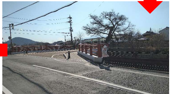
赤い蘇武橋を渡ると…