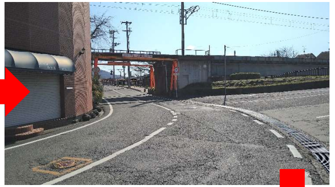
今井町方面へ道なり左カーブ！