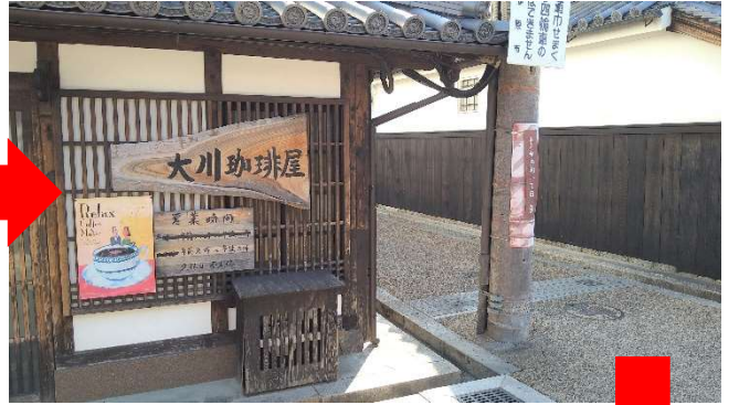
大川珈琲屋を左折！