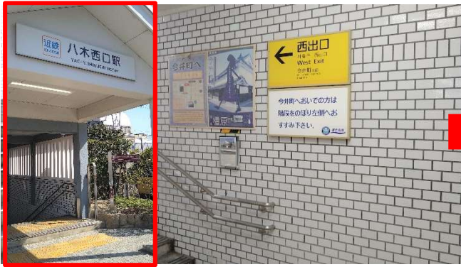
近鉄橿原線八木西口駅西出口を出発