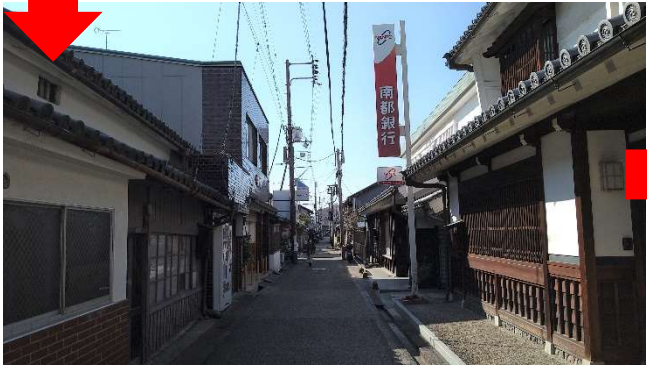
南都銀行を右手に直進