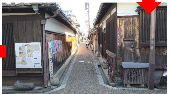
ここを過ぎればあと少し！