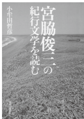
『宮脇俊三の紀行文学を読む』 小牟田哲彦 中央公論新社 2021.10

三省堂が毎年発表する「今年の新語」で「タイパ」が大賞に選ばれたのは2022年。Z世代を中心に広がったこの言葉も、今ではかなり浸透したのではないのでしょうか。動画の倍速視聴やカラオケのサビカラなどが、その一例として挙げられますが、奈良を通る予定のリニア中央新幹線も、タイパを追求した乗り物でしょう。しかし鉄道旅行では、急がずゆったり進む贅沢も選べます。今回は、旅情を誘う本を3冊ご紹介します。