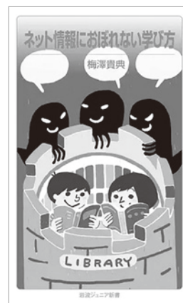
『ネット情報におぼれない学び方』 梅澤貴典 岩波ジュニア新書 2023.2

国会図書館元司書が公開する、題名のとおり「調べる技術」。知ることの執念みたいなものが伝わってきますが、不思議とその執念が楽しさに支えられているのではないかと思ってしまう。