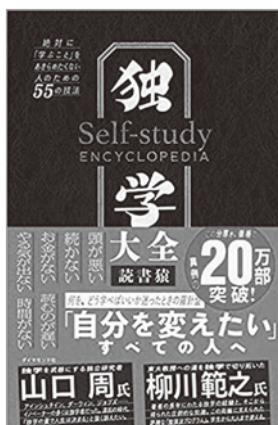
『独学大全 絶対に「学ぶこと」をあきらめたくない人のための55の技法』 読書猿 ダイヤモンド社 2020.9

知るは楽しみなりといひます。何かを知るために（あるいは学ぶために）人から教わることも多々ありますが、独り勝手気ままに心のおもむくまま、自らの好奇心に随って知の冒険に出かけるのもいいものです。何かに役立つため、とか何かのため（ということももちろんありますが）ではなく、自分の関心の声に耳を傾けながら進んでいきます。立ち止まっても、忘れてしまって引き返しても誰憚ることはありません。知りたい、学びたいという自分だけに意を向けます。それが本来の知ることや学ぶことの楽しみではないかという気がします。独学といってしまうと大仰になってしまいますが、独り知り、学ぶ楽しみは、誰の前にも開かれています。そしてそんな関心の声を聞く場所のひとつが図書館でもあります。明確な目的がなくても自らのことば（声）を探しに行ける場所といえるかもしれません。何しろあらゆる分野の本が整然と並べられているわけですから、森を散策するような気分では探してみてください。今回はそのような入り口になるかもしれない三冊を紹介します。