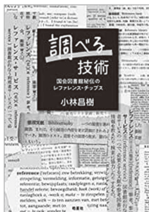
『調べる技術 国会図書館秘伝のレファレンス・チップス』 小林昌樹 皓星社 2022.12

技法と書かれているので、ある種のハウツーには違いないのですが、大きな森を前にして見通しのよい地図を見るような迫力があります。帯には「読むのが遅い。時間が無い。続かない。頭が悪い。お金がない。やる気が出ない。何を、どう学べばいいか迷ったときの羅針盤。「自分を変えたい」すべての人へ。」とあります。