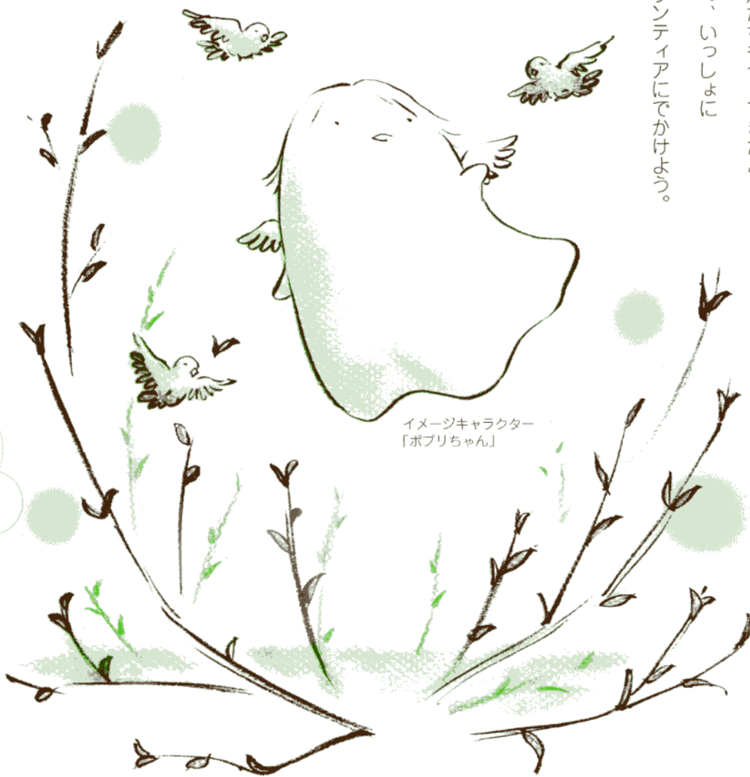
イメージキャラクター 「ボブリちゃん」

ほかほか陽気にさそわれて 小鳥たちもやってきたよ。 さあ、いっしょに ボランティアにでかけよう。