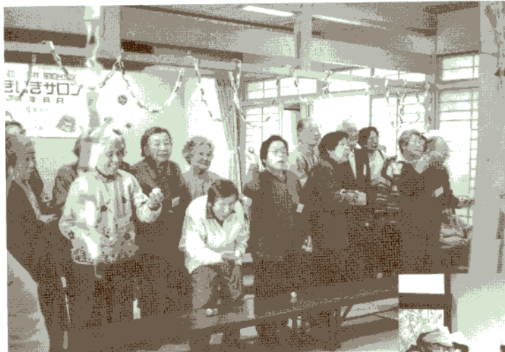
「いきいきサロン」節分の豆まき