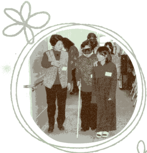
奈良県ボランティア連絡協議会 「ボランティアことはじめ」

奈良県中央ボランティアセンターでは、専任のボランティアコーディネーターを配置しています。活動運営上の課題やその他ボランティア活動に関するご相談等、お気軽にお問い合わせください。