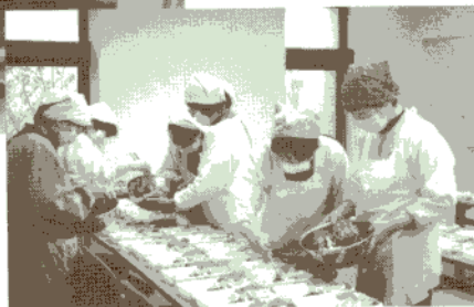
「福寿会」 給食サービスの調理

私たち河合町社協を拠点に活動するボランティアグループは、施設訪問型、地域活動型、手話サークルなど様々な分野があります。