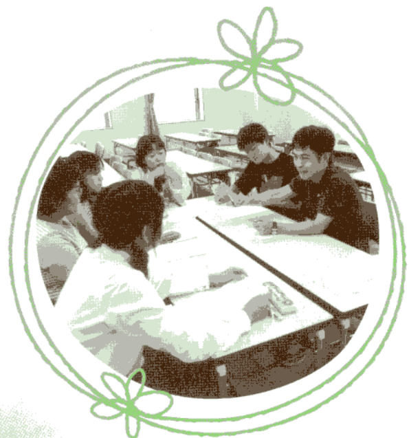
「なら ふれあい体験」事後研修会