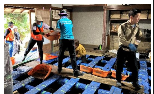
災害ボランティア活動の様子