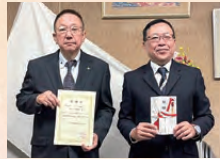
奈良県トラック協会 ダンブ部会 寄付金贈呈式