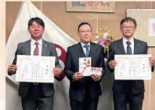
あいおいニッセイ同和奈良支店プロ会 あいおいニッセイ同和損害保険株式会社 奈良支店 防災用品贈呈式