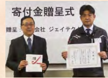
株式会社ジェイテクト 寄付金贈呈式