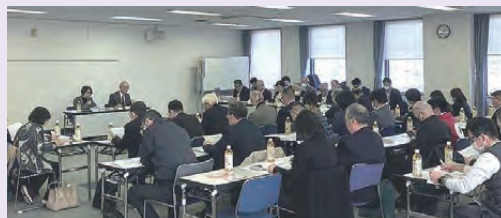
会場：奈良県社会福祉総合センター

懇談会には市町村共同募金委員会事務局を含め約50名が出席し、取り組みの現状の共有と意見交換を行いました。