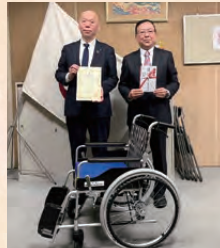
関西遊技機商業 協同組合 車いす贈呈式