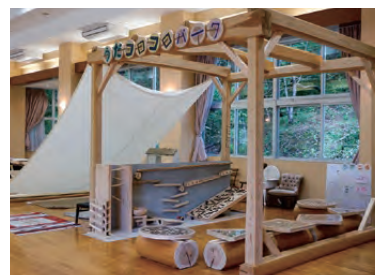
▲うだころころパーク

A 当時は平成榛原こどものもり公園内にある多目的ホールがほとんど使われていない状況だったので、常時利用でき、地元の木材を使って何かできないかと公園の指定管理者から当社に声がかかりました。おもちゃは専門外ということもあり、子どもの遊び場は子どもに任せようと考え、宇陀市内の中学校に声をかけたところ、市内4校の美術部（文化部）の生徒に協力してもらえることになりました。