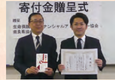
公益社団法人生命保険 ファイナンシャルアドバイザー 協会奈良県協会寄付金贈呈式