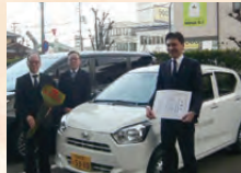
一般社団法人生命保険協会 奈良県協会 福祉巡回車両贈呈式