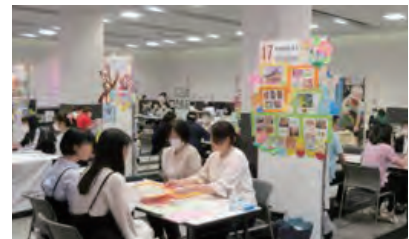
就職フェアの様子