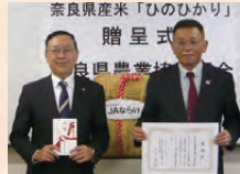
奈良県産米「ひのひかり」 贈呈式 奈良県農業協同組合 奈良県産米贈呈式