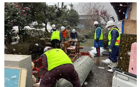
災害ボランティア活動の様子(R6 能登)

※講座内容については、組み合わせ可能です。ご不明な点はお気軽にお電話等でご相談ください。