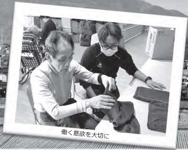
働く意欲を大切に

私たちは、障害のある方やさまざまな課題を抱えて支援を必要とされる方へ安心して生活できる場を提供し、日常生活や社会生活の自立を支援しています。利用者様が地域に暮らし、健康で心豊かに生活していただけるようにつとめています。