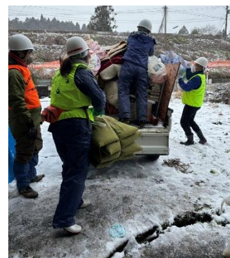
災害ボランティア活動の様子 (R6能登半島地震)