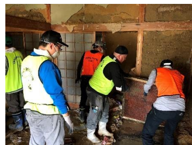
災害ボランティア活動の様子