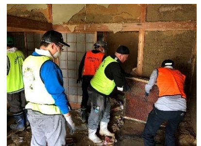
災害ボランティア活動の様子

※講座内容については、組み合わせ可能です。ご不明な点はお気軽にお電話等でご相談ください。