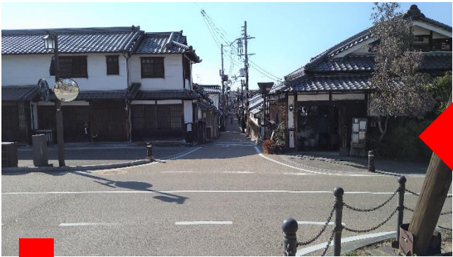
榎の大樹を右手に北尊坊通りへ