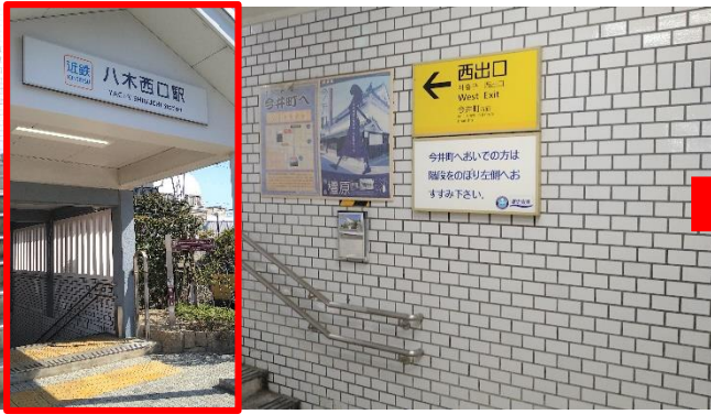
近鉄橿原線八木西口駅西出口を出発