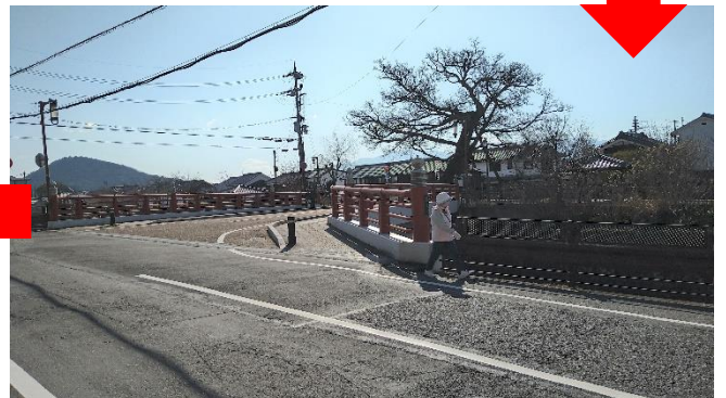
赤い蘇武橋を渡ると…