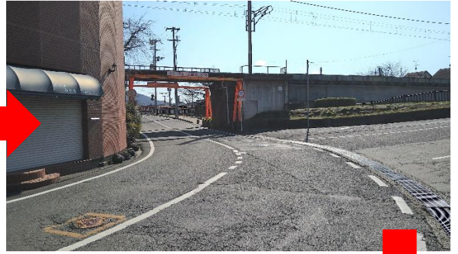
今井町方面へ道なり左カーブ！