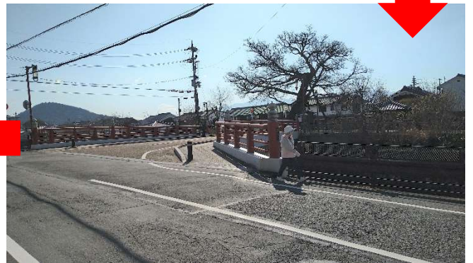
赤い蘇武橋を渡ると…