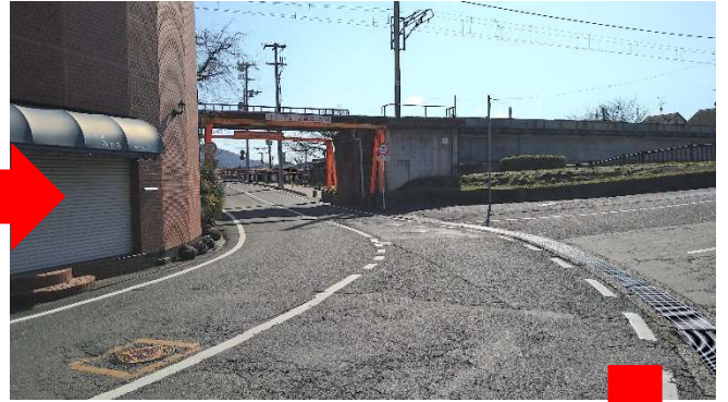
今井町方面へ道なり左カーブ！