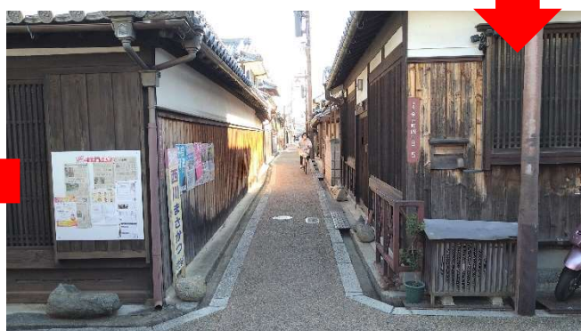
ここを過ぎればあと少し！