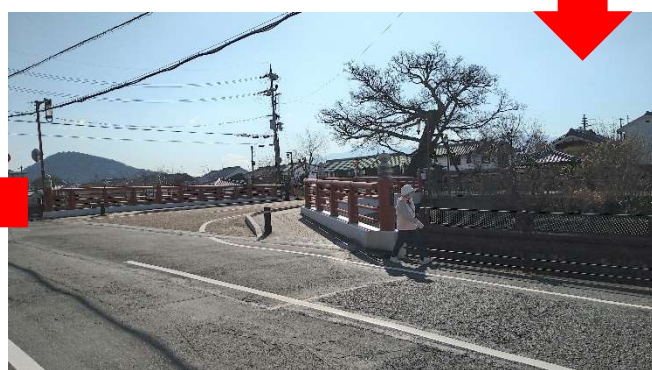
赤い蘇武橋を渡ると…