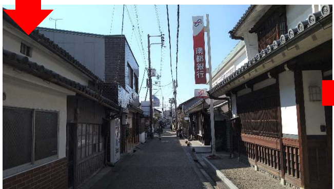
南都銀行を右手に直進