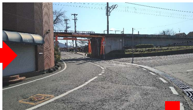
今井町方面へ道なり左カーブ！