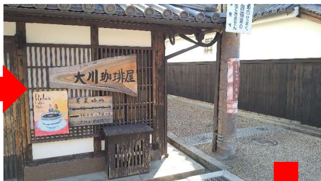
大川珈琲屋を左折！