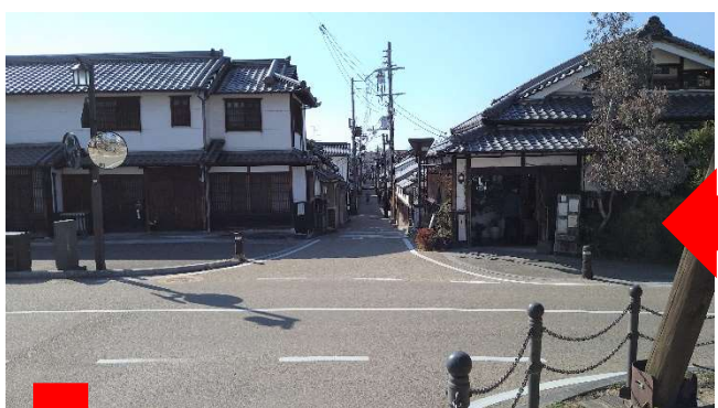
榎の大樹を右手に北尊坊通りへ