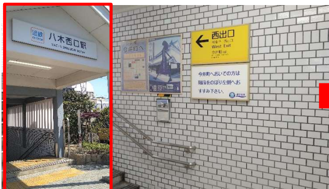
近鉄橿原線八木西口駅西出口を出発