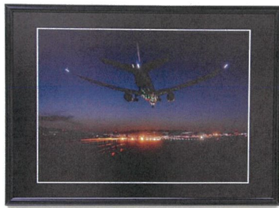
写真:小西 貞子さん「着陸3秒前」