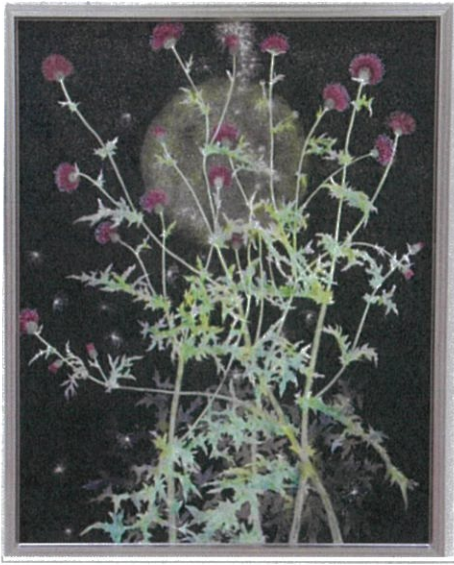
日本画:高谷 宣孝さん「野あざみ」