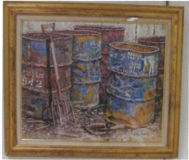
洋画:大口 育則さん「一隅」